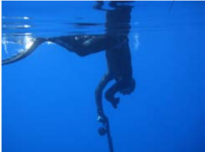
κατακρύφει ή διαγίννα βουτιά