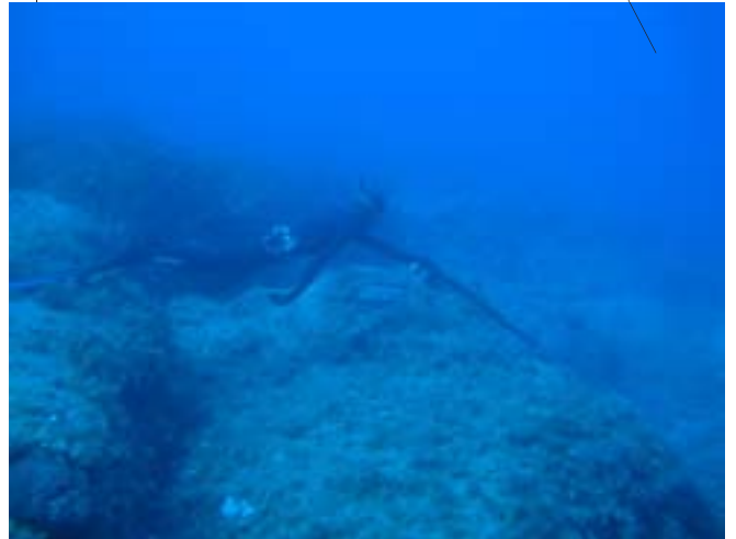
κοντεύουμε αλφάντα στο κόψιμο του βράχου